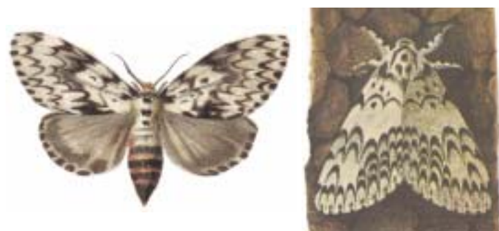
Bekyně mniška ( Lymantria monacha )

Mezi hmyzími řádými patří motýli k vývojově nejpokročilejším a druhově nejbohatším. Rozmanitostí je předčí jen brouci. Na světě je známo více než 150.000 různých motýlů a v českých zemích bylo zatím zjištěno přibližně 3.100 druhů. Na lesních dřevinách se u nás vyvíjí přes 700 druhů, z nichž několik desítek má schopnost se pravidelně nebo nepravidelně přemnožovat a citelně škodit (například bekyně mniška a obaleč dubový). Škody způsobují vždy housenky, a to nejčastěji žírem na listech nebo jehličí. Podle způsobu života rozlišujeme motýly denní a noční.