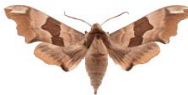
Lišaj lipový ( Mimas filiae )

Rozšířenými druhy nočních motýlů v této lokalitě jsou lišaji.