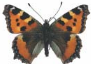
Babočka kopřivová ( Aglais urticae )

Rozšířenými druhy motýlů, kteří žijí v této lokalitě, na loukách a na okrajích lesů jsou babočky.