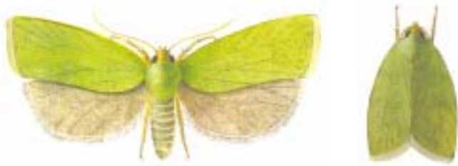
Obaleč dubový ( Tortrix viridana )

Motýl s křídlově bílými předními křídly, ozdobenými četnými tmavými příčnými vlnkami a skvrnkami. Zadní křídla jsou šedobílá s drobnými tmavšími skvrnkami při okraji. Bekyně mniška je vážným škůdcem smrkových a borových porostů, hostitelskými dřevinami mohou být i některé listnáče (buk, habr, bříza, javor). Mladé housenky ožirají mladé rašící jehličky nebo lístky, větší housenky se živí starším jehličím a rozvinutými listy.