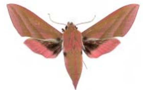
Lišaj vrbkový ( Deilephila elpenor )

Žije všude, kde se vyskytují lípy, a je velmi hojný. Jako většina nočních motýlů se živí šťávami z květů, které dokáže sát za letu. Orientuje se při tom podle vůně květů. Housenka okusuje lipové listy.